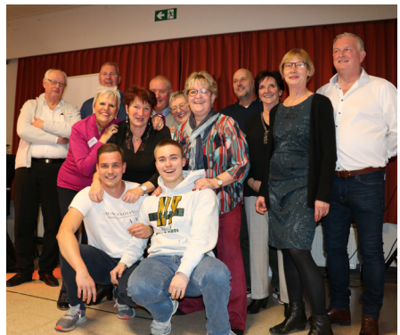
Het team van Samen NAP bereidt zich voor op de lokale verkiezingen.

Samen NAP heeft geen probleem met de noodzakelijke werken, maar we zullen wel rekening moeten houden met een moeilijke mobiliteitsperiode.